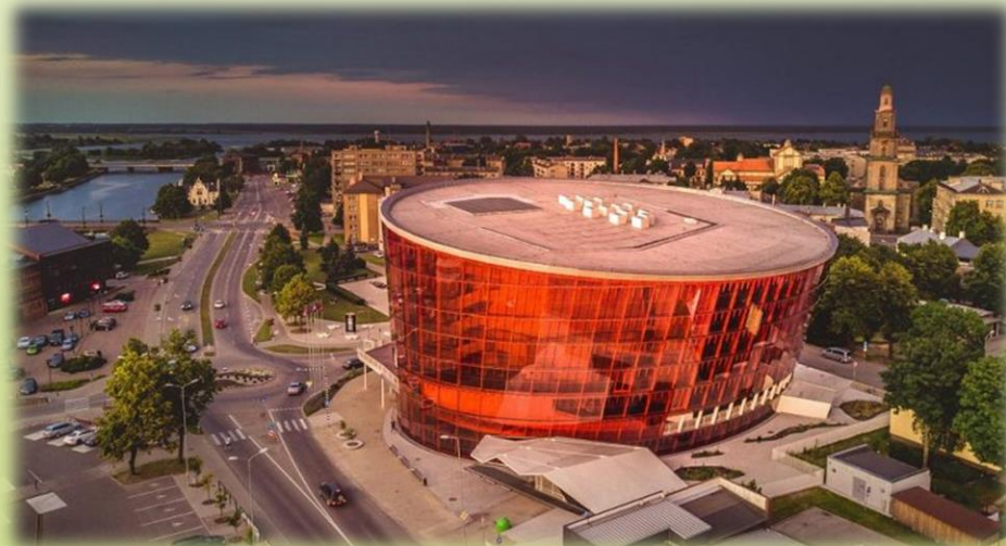
Ekskursija pa pilsētu, Liepājas koncertzāle "Lielais dzintars"

Cena: 70 EUR (Minimālais tūristu skaits grupā - 40)