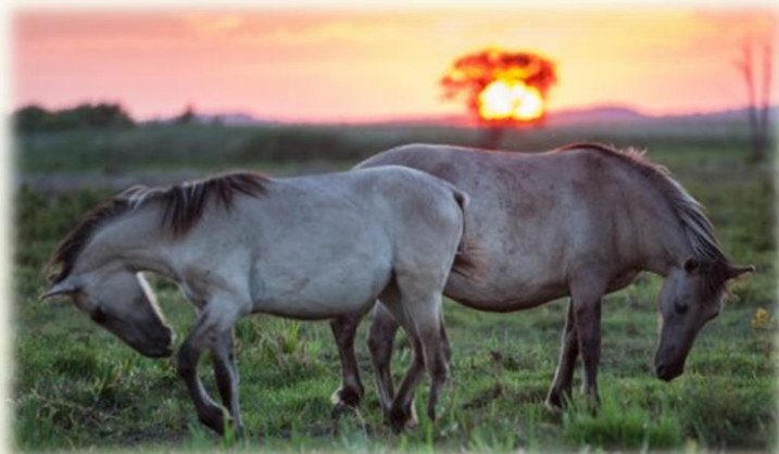
Dabas parks Pape