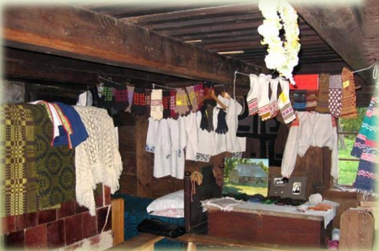
Etnogrāfiskā māja "Zvanītāji"