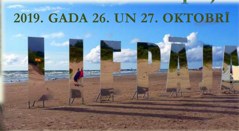
Jūrmalas parks, Zilā karoga Pludmale